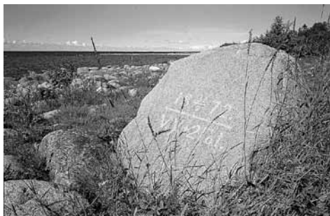
Vattenståndsmärke från 1872 på Rödkaullen.

Den landhöjningen är i högsta grad märkbar för kustbefolkningen, som får se barndomens bryggor och sjöbodas hamna på torra land. Många öar i skärgården kallas än i dag för grund eller skär, namn som bevarats från det att de steg upp ur havet för kanske 1000 år sedan. Och många öar, t.ex. Hertsön heter än i dag ö, fastän de nu hänger ihop med fastlandet.