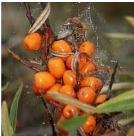
Havtorn, c-vitaminrika bär som kan bli läcker sylt eller saft.

De flesta av havsstrandens växter hittar man längs stranden. Utanför granskogen kommer oftast en bård av gråal, följd av pors och havtornsbuskar. Särskilt sista biten fram mot sundet till Strömmingsören växer täta snår av havtorn. Du känner lätt igen de låga buskarna på silverfärgade blad, vassa tornar och framåt hösten vackert orangefärgade bär.