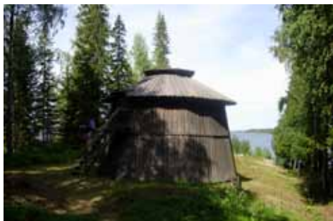
Den gamla kalkkugnen från början av 1900-talet.

Här öppnar sig en glänta i skogen med en plan byggd av varpsten. Även på denna varphög växer smultron. Annars är lavar nästan det enda som klarar den brännrotta miljön. Bakom ligger gruvhålet omgärdat med stängsel. Hålet är 4x4 meter och 18 meter djupt. Det är svårt