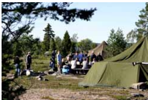
Det finns en uthyrningsstuga på Brändöskär men det går också bra att ha eget tält med sig!