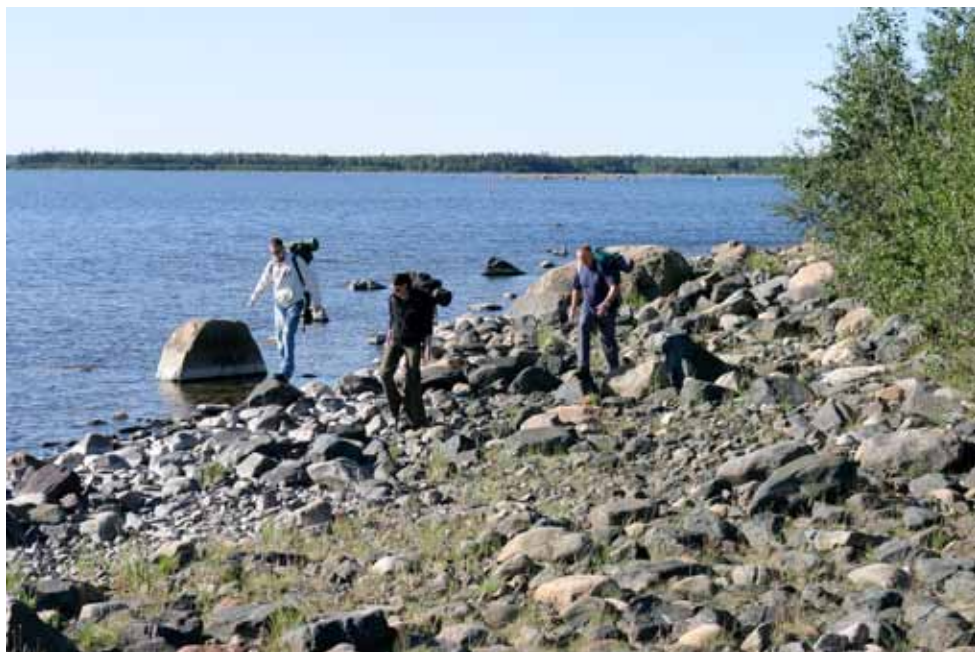
Några vandrare på Hindersön vid Svartören.

Genom skärgårdsleden är det nu möjligt för vem som helst att till fots vandra från fastlandet ut till de allra yttersta öarna. Vandrigen är bitvis tämligen krävande, även om det knappast är några höjdskillnader att tala om. Längs vissa sträckor går leden fram på klapperstensstränder, som kräver både balans och vighet. Leden följer befintliga stigar eller vägar till stor del. Längs andra sträckor följer man strandlinjen. Den är endast på några sträckor markerad i terrängen. Det är den tryckta guiden som förklarar vägen längs hela skärgårdsleden.