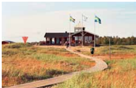
Luleå Segelsällskaps klubbstuga på Likskär.

broms och mygg kan göra att man springer fort! Sista biten går fram i ett kulturlandskap med gamla odlingsmarker och lövskogar där spåren är många efter en spännande industrihistoria.