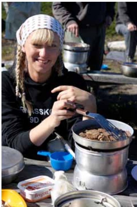
Framme vid slutmålet är det dags för en riktigt god middag!

Utanför Brändöskär upphör vintertid den släta fina havsisen och den sönderbrutna packisen tar vid mot öster. Det var i den miljön gamla tiders säljägare färdades, med fäl-båtar som kunde skjutas på isen. Med hjälp av skredstången, en lång skida med ett skyddande vitt segel, kunde den liggande skytten krypa sig fram inom skotthåll.