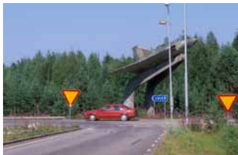
Vigenplanet vid vägen utanför Luleå Airport.

Från Luleå/Kallax flygstation vandrar man till fots de tre kilometrarna till Tjuvholmssundet. Följ utfarten mot Luleå från parkeringsplatsen. Efter hundra meter delar sig vägen vid ett stort Vigenplan som staty. Vägen åt vänster leder mot Luleå. Vägen åt höger leder mot Lulviksbadet och Tjuvholmssundet. Följ den. Snabbast går man längs vägen, men här och var finns en parallell stig på högra sidan ett tiotal meter in i skogen, om man hellre vill känna den mjuka sanden under fötterna.