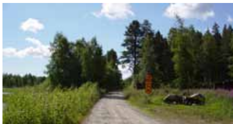
Vägbanken mellan Tjuvholmen och Sandön.

Tallhedar och på fuktigare marker täta gran-skogar breder ut sig på ön. Stränderna kantas oftast av en bård av björk och gråal. På ön finns även jordbruksmark vid Sandögårdarna. Öns mest spännande natur är klapperstensfältet och det levande dynlandskapet på Sandöklubben, längst österut.