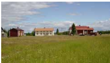
En av Sandöns stora gårdar.

Sandögårdarna anlades som skärgårdsjordbruk redan i slutet av 1700-talet. Fem hemman finns i byn. Fram till 1997 hölls fjällkor för mjölkproduktion. På sensommaren, när vallar och kornåkrar var skördade fick de beta fritt över ön. Det berättas att det långt ifrån gården gick kostigar längs strandskogen. Varje kväll kom korna åter till ladugården för att mjölkas. Som mest har det funnits ett 30-tal mjölkkor på ön förutom ungdjur, hästar, grisar, får och höns. När denna text skrivs finns bara några ungdjur kvar i byn. Delar av vallarna slås fortfarande för att ge foder åt djuren.