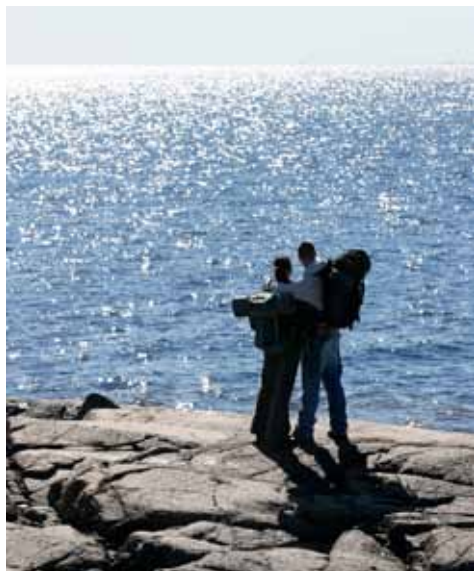
Från Haraskäret eller Klubben har man en vidunderlig utsikt västerut.

Snart tar stigen höjd och man kommer ut på vackra klapperstensfält, svallade av havet kring Kristi födelse. En, mjölon, kråkbär och mjölke trivs i den torra karga miljön. Här uppifrån är utsikten från det utställda rastbordet hisnande vacker mot väster. Kanske en plats att njuta av solnedgången? Haraskäret hänger nu ihop med den sista ön Brändöskäret. Dit är vandringen nu kort.