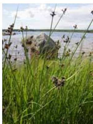
Blåsäv i strandkanten.

På sandstranden växer många stråväxter som är specialister på att binda sanden. Bladvass