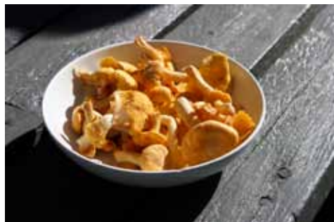
Finfina kantareller plockade på Brändöskär.

Vi blir avlämnade på Norra eller Södra sidan av Saxskärets västra udde, beroende på vinden. Sedan följer man Saxskärets södra strand som övergår till Uddskärets västra strand. Stranden är relativt lättgången, men man ska vara medveten om att det handlar om att gå på blockmark, nästan hela vägen. Man får ha koncentrationen fäst på var man sätter sina fötter.