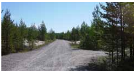
Vi följer vägen åt höger.

Nu kommer vi över på den egentliga Sandön. Här finns många sommarstugor men även flera permanenta bosättningar, bland annat en riktigt jordbruk som vi ska gå förbi längre fram. Vi följer nu vägen rakt fram. Den går igenom en rätt mager skog, typisk för den torra sandmarken på ön. Efter en kilometers vandring från båtläningen viker en sandig väg av åt höger. Den ska vi följa.