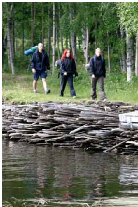
Stränderna längs Altappen består av virkesspill-spinkved

ön större. Från torrbacken vid smedjorna ser man de märkliga stränderna som alltså består av virkesspill. Tänk att det legat här 100 år! Man trampar verkligen på industrihistorisk mark när man går ned till stranden.