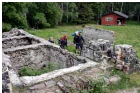
Husgrunder efter Altappens blomstrande industrisamhälle.

Mitt i december 1890 brann sågverket ned, men byggdes snart upp igen. Den 3 juli 1908 drabbade en ännu värre katastrof samhället. En gnista från en ångbåt antände ett virkeslager och praktiskt taget alla anläggningar och all bebyggelse brann upp. Hundratals människor stod hemlösa och fick fly i båtar till fastlandet utan sina ägodelar. Brinnande material flög till och med ända till Sandön där den knastertorra tallheden fattade eld. Spår efter den skogsbranden syns tydligt i de levande tallarna än idag.