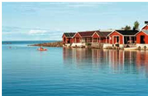
Luleå skärgårds vackraste fiskeläge?